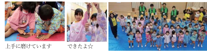
上手に磨けています できたよ☆ 記念撮影

10月23日(火) 年少から年長クラスの40名で『森のかけらのお守りづくり』を行いました。年少さんが紙やすりを扱うことができる心配でしたが、年中、年長クラスのお兄ちゃん、お姉ちゃんがするのを真似して、上手に取り組むことができました！