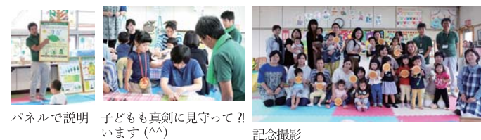
パネルで説明 子どもも真剣に見守っています(^ ^) 記念撮影

子育て支援センターより「お母さんたちへの木育」について相談があり、高千穂町の農林振興課、子育て支援センター、西臼杵支庁の福祉課と林務課が連携し、9月28日(金)13名のお母さんに「森林の二酸化炭素固定機能」をテーマに説明した後、「MYはしづくり」を行いました。その結果、今後も定期的な木育講座の開催希望があったため、山や森林に関する勉強と季節に応じた木工を組み合わせたプログラムを立てました。