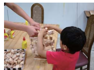
毎年人気☆『ボール転がし』