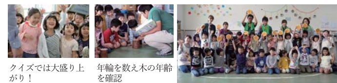
クイズでは大盛り上がり！ 年輪を数え木の年齢を確認 記念撮影

10月15日(月) 年長と年中クラスの園児28名へ木育活動を行いました。導入では先生に木育に関する絵本を読んでいただき、その後、森林クイズを出し、「森のかけらのお守りづくり」を行いました。「もりのかけらのお守りづくり」では、お気に入りの木片を探し出し磨いてもらうようにしたところ、「自分で選んだ」という意識になり、懸命に取り組む姿が見られました。