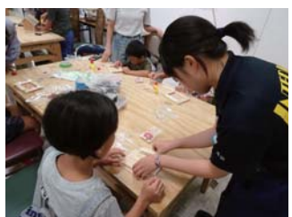
宮崎工業高校生もお手伝い！