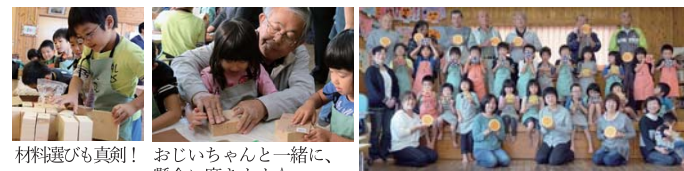
材料選びも真剣！ おじいちゃんと一緒に、懸命に磨きます☆ 記念撮影

10月18日(木) 敬老参観で、おじいちゃん、おばあちゃんと一緒に、端材で『老眼鏡がけ』を作りました。おじいちゃんから、「昔は木材の切れ端で色々作って遊んでいたが、今の子ども達はそのような機会もないので、保育園で経験できるのはありがたい」との感想がありました。また、一緒に製作することで、お孫さんの成長に驚き、喜ぶ姿も見られました。