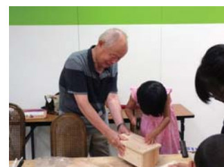
木育サポーターと一緒に『宝箱作り』

日時：平成30年8月8日(火)～16日(木) 10:00～19:30 最終日は17:00終了 場所：宮崎山形屋5階催事場