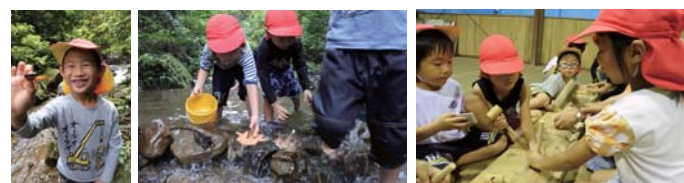
カニ、みつけたよ♪ いざ出発！「いけー！」 マイ木槌づくり

年長児を対象に木育(ネイチャーアクション)を年6回実施しています。今回は8月と10月の取り組みをご紹介します。 ・沢あそび！「沢の流れ、音、水の感触、周りの植物や生き物に触れる」 8月24日(金) 場所：ボーイスカウト宮崎連盟野外訓練センター 廃材で作った舟を沢で浮かべ、何度も泳がせました。沢の生きものも見つけ大満足！昼食後は、自分専用の木槌を作り、大喜びの子ども達でした(^ ^)