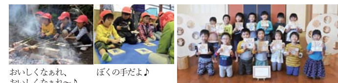
おいしくなあれ、おいしくなあれ〜♪ ぼくの手だよ 記念撮影

・もりのコックさん！「火の大切さ、火のおこし方を知り、食べ物を作る喜びを知る」 10月19日(金) 場所：ボーイスカウト宮崎連盟野外訓練センター 火の役割や大切さを学んだあと、実際にマッチ刷り体験。怖がりながらも火がつかました。その後、自分たちで生地を竹に巻き付けツイストパンを作り焼きました♪焼き芋も一緒に楽しみました。午後は、先生が手形を切り抜き、手形ツリーを製作しました。大きくなった時に手形を見て幼少期の楽しかったことを思い出して欲しいです(^ ^)