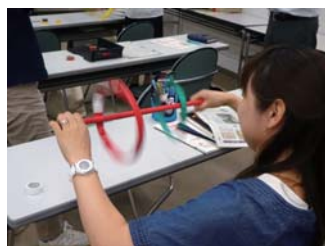
2本の輪を違う方向に回します。回った瞬間、歓声が(^_^)