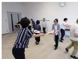
新聞の棒2本を使ってキャッチ棒！相手の呼吸と合わせるのがコツ☆

今年度も昨年度同様、子どもの発達に合わせておもちゃを選ぶことが大切であることを学びました。脳の感覚野・運動野では手と顔に関係する部分の割合が大きいため、遊びの中で手と顔を動かすことが大事であること、何よりも、大人と一緒に楽しむことが、子どもの情緒を豊かに育むことを学びました。また、現在、多く報告されているSNSでのトラブルや課金トラブルなどメディアによるトラブルですが、幼少期からスマートフォンやタブレットなどで遊ばせていると、メディア依存症になりやすいことも分かり始めています。保護者自身がメディアから離れ、子どもと向き合うことが大切だと感じました。