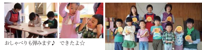
おしゃべりも弾みます♪ できたよ☆ 記念撮影

10月25日(木)、地域のボランティアの方3名にご協力いただき、年中、年長クラス6名と『森のかけらのお守りづくり』を行いました。ボランティアの方とも楽しくおしゃべりしながら製作し、ボランティアの方からは「子ども達と一緒に活動すると元気がもらえる」と感想を頂きました。今後も、地域の世代間交流ができるような取り組みにしたいと思います。